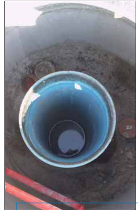
Schachtkopf einer Brunnenanlage.

Nach Inbetriebnahme der Anlage wird eine Absenkung pro Woche in Höhe von ca. 10 cm erfolgen, bis das gewünschte Absenkziel unter der Fundamentierung erreicht wird. Am Anfang wird eine wöchentliche Dokumentation der Absenkung erfolgen. Die Anlagen arbeiten weitgehend störungsfrei. Falls allerdings Verockerungen durch einen hohen Eisengehalt im Grundwasser vorliegen kann ein erhöhter Reinigungsaufwand des Systems notwendig sein.