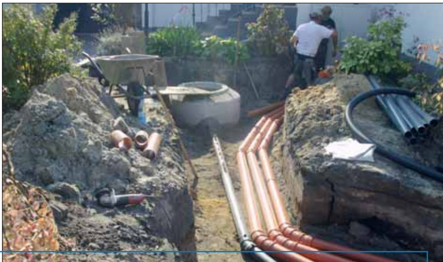
Zuleitungen zu einer Brunnenanlage und zur Elektrostation.

Der Abstand zwischen Geländeoberfläche und Grundwasseroberfläche wird mit Flurabstand oder Grundwasserflurabstand bezeichnet. Durch untertägigen Kohleabbau kann sich der Flurabstand insbesondere in Senkungstiefpunkten an der Tagesoberfläche negativ verändern, d.h., die wasserführende Schicht weist dort einen geringeren Abstand zur Tagesoberfläche auf.