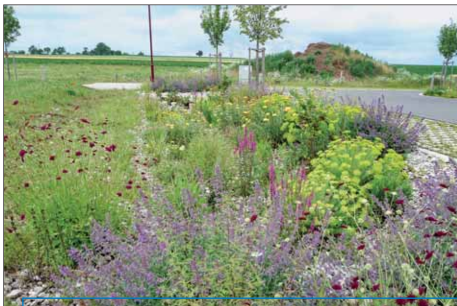
Begrünte Fläche oberhalb einer Regenwassernutzungsanlage in einem Neubaugebiet.

der immer weiter steigenden Abwassergebühren zu der Einsicht, dass nicht für jeden Verwendungszweck „Trinkwasserqualität“ erforderlich ist. Bereits zu Zeiten von Oma und Opa wurden für die Gartenbewässerung Regentonnen oder alte Zinkwannen zum Auffangen von Regenwasser genutzt. Heute sind diese Behältnisse schon wieder Standard. Regenwasser kann darüber hinaus auch für die Toilettenspülung, das Reinigen von Haus und Hof und auch zum Wäschewaschen verwendet werden. Letzgenannte Verwendung hat insbesondere den Vorteil, dass Regenwasser „weich“, d. h., kalkarm ist. Hierüber können sich sowohl die Wäsche, der/die Träger/in aber auch die Maschinen „freuen“. Letztendlich dient dies auch der Langlebigkeit der Produkte und damit der Schonung des eigenen Geldbeutels. Regenwasser wird somit zum „Betriebswasser“. Die Gewinnung von „Betriebswasser“ ist aber von einigen Parametern für die Dimensionierung einer RWNA abhängig, u. a. vom Wohnort, der Größe der zur Verfügung stehenden Dachfläche, der Beschaffenheit der Dachdeckung (Tonziegel glasiert/unglasiert, Betondachsteine, Schiefer, Wellblech/Metall etc.), dem Bedarf für WC-Spülung, Waschmaschine, Gartenbewässerung, der Anzahl der Personen im Haushalt u. a. Im Internet finden sich eine Vielzahl von Rechnern zu Regenwassergewinnung und Wasserverbrauchsermittlung. Zu beachten ist bei der Gewinnung von Regenwasser, dass nicht alle Auffangflächen geeignet sind. Ungeeignet sind vor allem Bitumen-