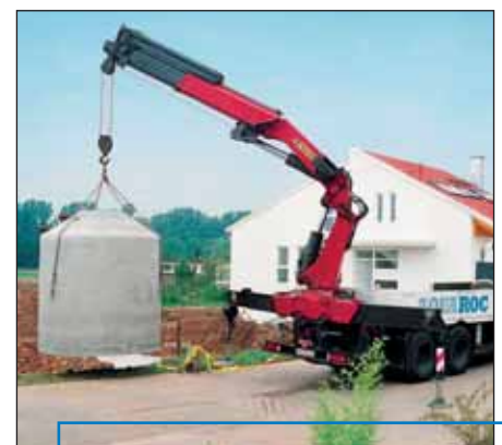
Anlieferung einer Zisterne aus Beton.